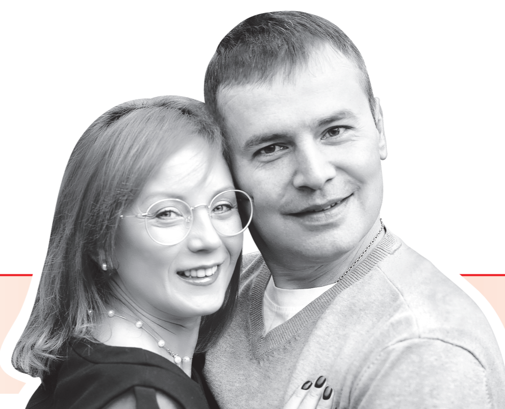
СЕМЬЯ, РОДИТЕЛИ ЧЕТЫРЕХ ДЕТЕЙ