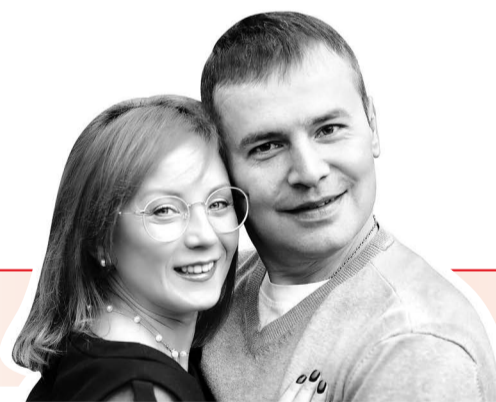
СЕМЬЯ, РОДИТЕЛИ ЧЕТЫРЕХ ДЕТЕЙ